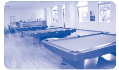
寮内にカラオケルームやビリヤード場も設置。