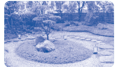
日本庭園のある本格的な茶室。心あられる和の時間を過ごせます。