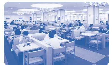
明るくゆったりとした食堂。食事をしながら楽しい会話がはずみます。