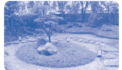
日本庭園のある本格的な茶室。心あられる和の時間を過ごせます。